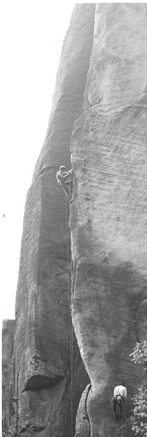
Hrana pádů 1982

Musíme být připraveni na nebezpečí a situace, jejichž důsledkem jsou vážné nehody a úmrtí. Všichni, kdo se věnují horským sportům, by měli jasně rozumět rizikům a nebezpečí a měli by vědět, že musí mít náležitě dovednosti, znalosti a vybavení. Musí být připraveni pomoci ostatním v mimořádných situacích a při nehodách, a také musí být připraveni čelit důsledkům tragédie. Je žádoucí, aby zejména komerční vůdci upozornili své klienty, že jejich cíle mohou být obětovány v zájmu pomoci těm, kdo se nachází jiným v tísni.