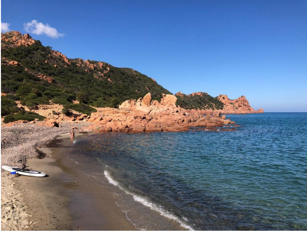
Pláž Cala Luas s blízkým DWS spotem

Následný den, jsme se pohodlně jen kousek přesunuly na pláž Cala Francese a už nám bylo jasné, že místo hledaného spotu DWS dle internetu jsme našli jiný. Na oné vyšší stěně jsme se ten den na střídačku vyblbli a děti byli spokojené na písčité pláži. To ráno jsem se jel projet na horákovi, že objedu trasu naznačenou na mapách.cz. Bohužel jsem to cca 20 min. nošení kola klečí vzdal obrátil. Vydal jsem se na průzkum přístupu k pláži Luas. Průzkum byl úspěšný, a tak jsme se tam vydali s krátkým přejezdem pěšky hezkou procházkou. Pěkná, malá a zastrčená pláž nám poskytla celý den prakticky v soukromí. Parádně jsme se prostřídali na DWS a v pod večer se vydali na západní pobřeží.