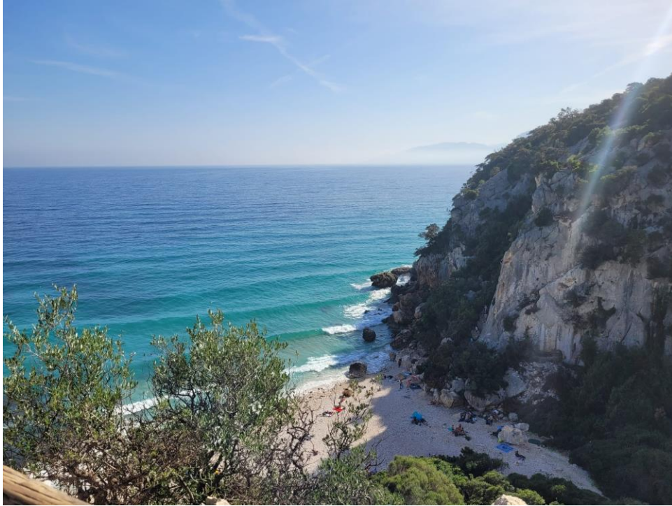
Foto pláže a lezení

Večer následoval přejezd do lezecké destinace na pláži Cala Golone. Z hlediska lezení se nám za dva dny podařilo vylézt pouze jednu cestu, jelikož byli na středozevní moře poměrně velké vlny a tak byla veškerá pozornost přes den věnována aktivitám s dětmi. Vystřídali jsme se po ránu místo snídaně tatík na kole po okolí a odpoledne mamina výběh na pláž Cala Luna. Cílem výběhu, byl průzkum jak by cesta byla přijatelná pro naše holky 5 a 3 roky. Zjištění, že cesta by byla poměrně náročná pro menší dítě, jsme si tento výlet nechali až na příště a jeli do další destinace. Spaní v autě na Cala Golone je celkem v pohodě na parkovištích podél slepé silnice, pouze nelze být „vycikáněný“. Každé ráno projíždí policie a zdvořile upozorňuje, že je nutné vše uklidit do auta aby bylo jako normálně zaparkované.