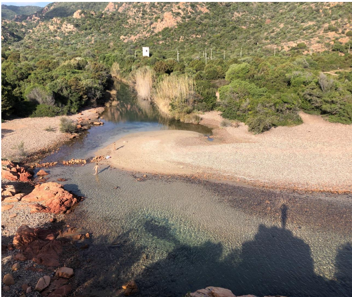
brouzdaliště pro děti gps kempiku: 39°45.21655'N, 9°40.37139'E

Vrtalo mi ale hlavou, že orientace stěny je na opačnou stranu, než jak to bylo na internetu. Nicméně plán na další den byl jasný. U kempu byli na internetu typy na krásné parkování na divoko, nicméně tam za poslední roky asi všude dodaly cedule „No free camping“ Neměli jsme chuť a odvahu se tam vykempit a tak jsme se vydali na cestou vytypované velké parkoviště pro karavany. Tam po nás nakonec chtěli 15 E/noc, ale bylo to krásné místo s bářem a parádní zátokou pro děti.