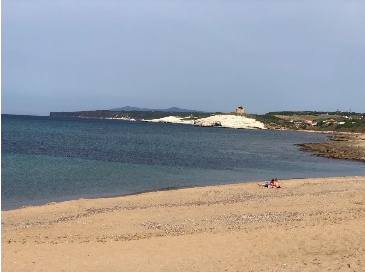
Pláž s jeskyní v dále pod majákem gps parkování: 40°4.65050'N, 8°29.51229'E

Doporučení: skvělá lokální (hrnatá) pizza a milá obsluha v pizzerce zde: 39°47.59671'N, 9°30.99668'E