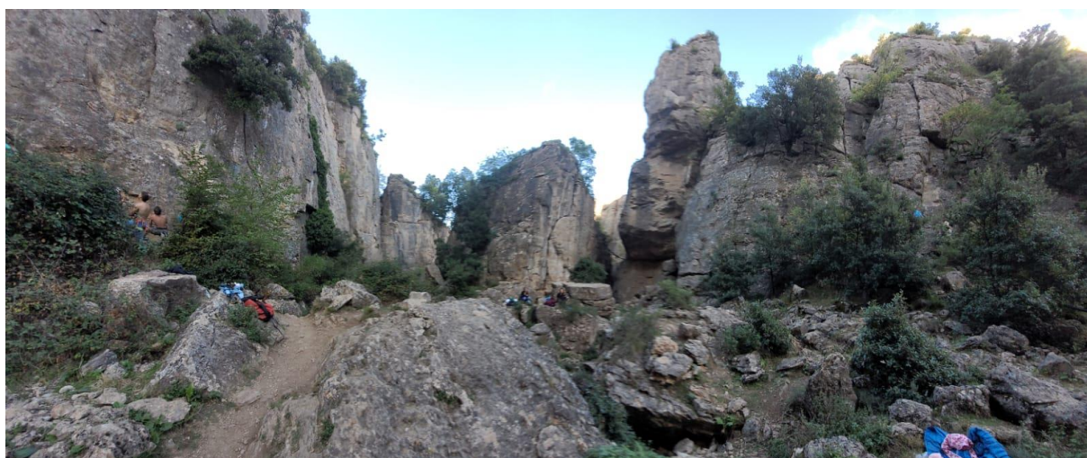
Lezecký sektor v horní části Caňonu