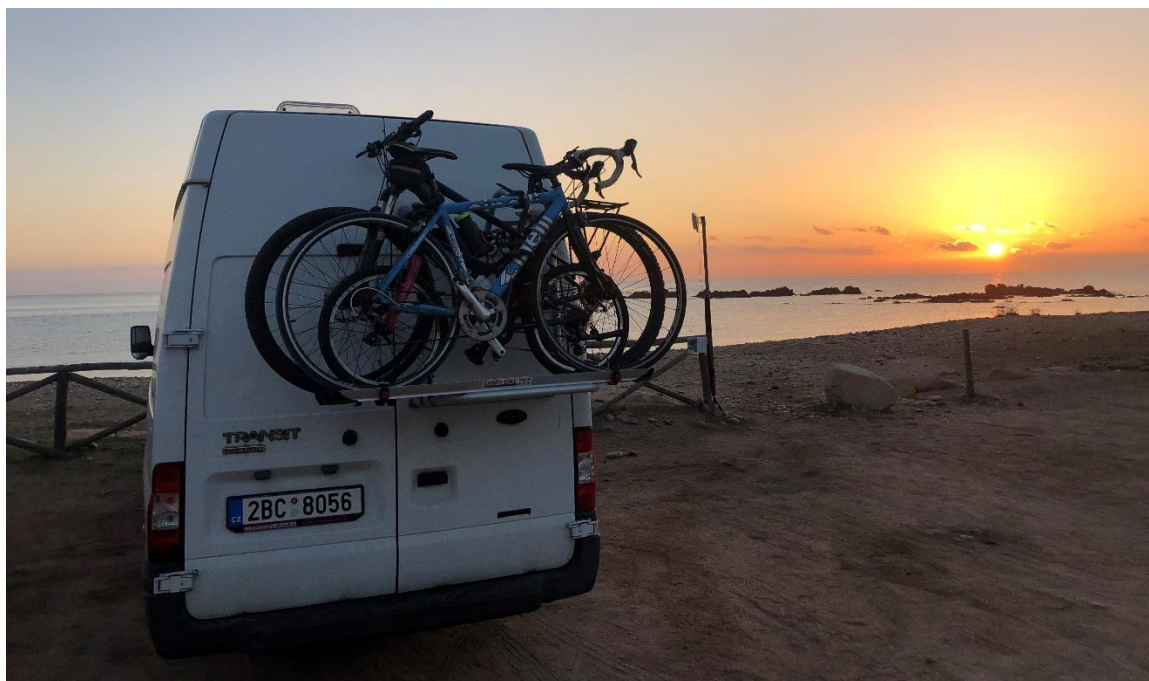
Východ slunce u báru