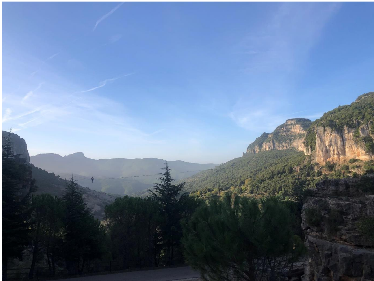
Pohled z terásky hospůdky lezeckého kempu THELEME v Ulassai

Následující destinace byla vyloženě lezecká Ulassai s nočním přejezdem. Z hlediska ušetření času, jízdy v noci, jsme přišli o nádherné výhledy ze silnice k této vnitrozemní horské destinaci. Na spaní jsme tam našli relativně dobré místo na jednu noc, na více nocí s dětmi se nám to moc nelíbilo a tak jsme byli smířeni s ubytováním v kempiku a zdrželi jsme se 2 noci. Kemp nás vycházel s dětmi za darmo na 25 E/noc. V blízkosti kempu jsme prozkoumali 2 lezecké sektory, které by byli oba dva na další návštěvy. Cave of Dream a Canon Ulassai horní část, kanon jsme si pak celý prošli směrem dolů do města. Dole na konci kaňonu, resp. na začátku od města, jsme objevili 2 parádní placy pro děti s pěknými cestami pro nás. Dle domluvy s dětmi jsme ovšem příští ráno odjžděli na pláž.