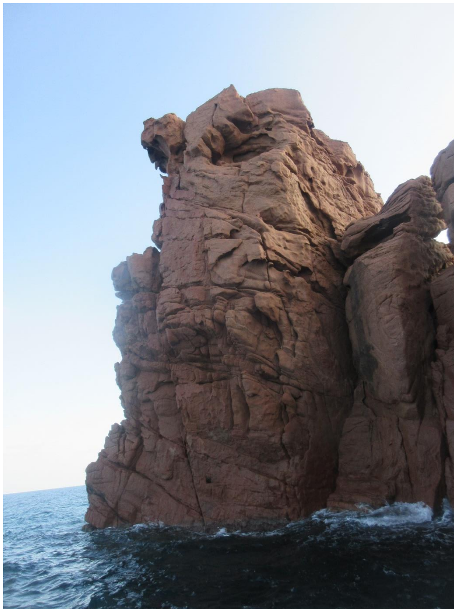
cca 15m vysoká stěna na DWS, gps: 39°44.65774'N, 9°40.60858'E video na youtube https://www.youtube.com/watch?v=WuOZKv9OYp4

Z hlediska nutkání si zalézt více po skalách jsme na internetu našli nedalekou pláž Cala e Luas, kde byli k nalezení DWS cesty. Prý je nutná loď k příjezdu ke skalám, tak už jsme žhavili paddleboard. Dopol jsme přijeli na vytypovanou pláž vedle campu poblíž pláže Cala Luas. Tam na oblázkové pláži jsme se vykempili a zanedlouho už jsem pádloval na průzkum s lezečkama přicvaklými na prkně. Uvedenou pláž jsem přešel až sem dopádloval k pláži Cala Francese a tam jsem objevil vysokou stěnu s patřičně hlubokým dopadištěm. Vyzkoušel jsem a prostoupil tuto cca 15m vysokou stěnou asi nejlehčí cestou. Z vrchu slezl kousek níže a z plošiny jako můstek poslal tak desítku do vody. Následně se tam vyblbla i Pěťa.