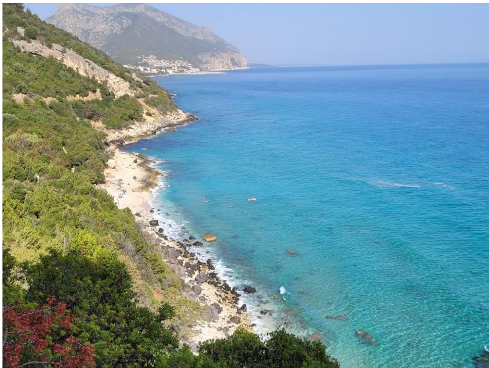
Pláž pod parkingem

gps parkovani: 40°15.70031'N, 9°37.56693'E